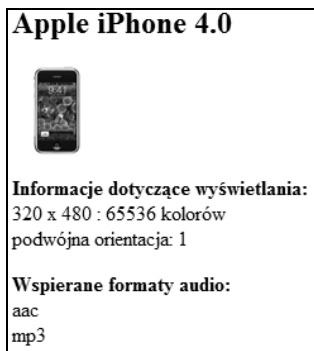
Rysunek 3.2. Wynik działania skryptu z listingu 3.18 — wyświetlenie zdjęcia urządzenia

echo "Zdjęcie niedostępne"; } //informacje dotyczące wyświetlania print "<p><strong>Informacje dotyczące wyświetlania: </strong><br/>"; print $teraWURFL->getDeviceCapability( 'resolution_width' ) . " x "; //szerokość print $teraWURFL->getDeviceCapability( 'resolution_height' ) . " : "; //wysokość print $teraWURFL->getDeviceCapability( 'colors' ) . ' kolorów<br/>'; print "podwójna orientacja: " . $teraWURFL->getDeviceCapability( 'dual_orientation' ); print "</p>"; //informacje dotyczące dźwięku print "<p><strong>Wspierane formaty audio:</strong><br/>"; foreach ( $teraWURFL->capabilities['sound_format'] as $nazwa => $wartosc ) { if ( $wartosc == "true" ) { print $nazwa . "<br/>"; } } print "</p>"; } else { print "urządzenie nie zostało rozpoznane"; } ?>